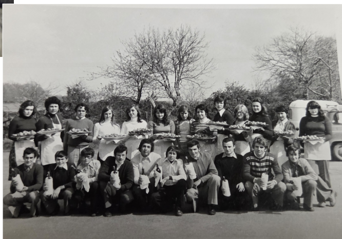
Serveuses et serveurs du repas des aînés en 1975